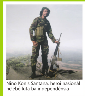
Nino Konis Santana, heroi nasional ne'ebé luta ba independéncia

Parque Nacional hanaran tuir (Antonino Santana), 'Nino Konis Santana' (1955 – 1998). Heroi nasional, ne'ebe sakrifika aan, luta ba independéncia nasional. Chefe do Conselho Executivo Comité Executivo da Luta – Frente Armada (1992 – 1998).