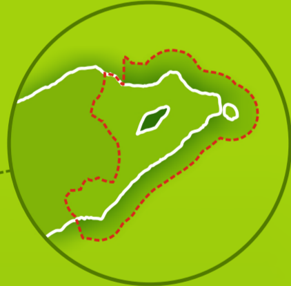
Parque Nacional Nino Konis Santana Kobre tomak parte leste nia rohan husi Timor-Leste

Parque Nacional Nino Konis Santana hanesan primeiru Parque Nacional iha Timor-Leste. Fatin iha distritu Lautem, Parque Nacional ida ne'ebé komposto hosi parte terrestre no marina ho luan total 123,600 ha, hosi rai 68,000 ha no tasi laran 55,600 kobre três nautical mil tama ba tasi.